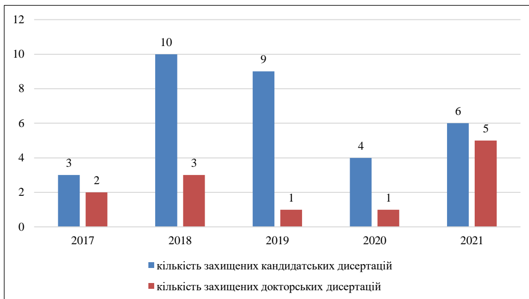
Рис. 5. Контингент аспірантів та докторантів МДУ